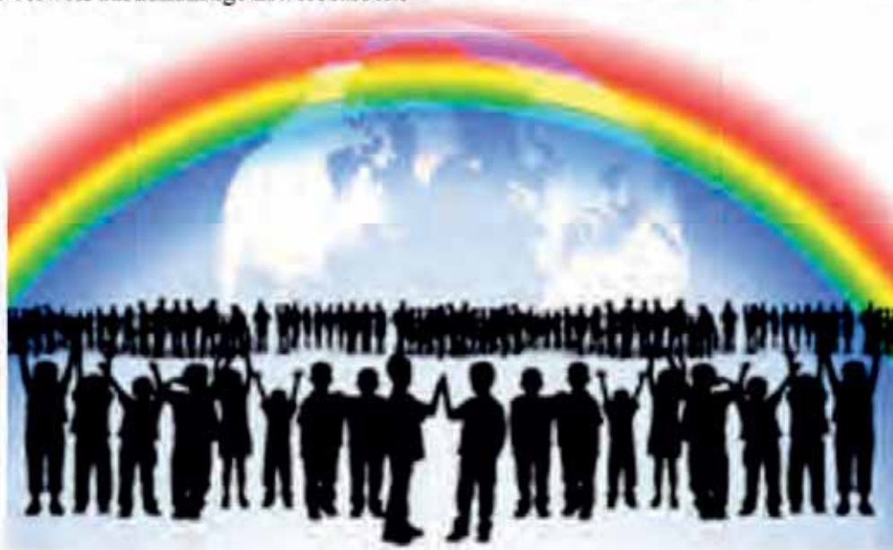
Dieser Text ist im Internet-Gesprächsforum „Gutesleben“ entstanden

14. Das garantierte Grundeinkommen und die angemessene Honorierung der Haus- und Familienarbeit sind auch Voraussetzung dafür, dass viele Menschen in Freiheit auf vielfältige Weise ehrenamtlich und freiwillig tätig sein können. Denn nur wer nicht voll ausgelastet ist mit der Fürsorge und Existenzsicherung für sich und seine oder ihre Angehörigen, hat die Chance, freiwillig Dinge zu tun, die nicht im strengen Sinne notwendig, aber für die erneuernde Gestaltung der Welt wesentlich sind. Ehrenamt und Freiwilligenarbeit bergen wichtige Potentiale an Innovation und kreativer Entwicklung, denn sie können neue Ideen in die Welt bringen, ohne von der Notwendigkeit, sich im Sinne der Existenzsicherung „rentieren“ zu müssen, eingeschränkt zu werden. Während Erwerbsarbeit und Haus- und Familienarbeit eher für die Kontinuität des Erreichten sorgen, trägt freiwillige Arbeit vor allem zur kreativen Neugestaltung der Welt bei. Die Beziehung zwischen bezahlter und unbezahlter Arbeit muss immer neu im Interesse des guten Zusammenlebens aller so ausgehandelt werden, dass weder die Sicherung und Kontinuität noch die kreative Erneuerung des Ganzen leidet. Haus- und Familienarbeit, Erwerbsarbeit und ehrenamtliche Arbeit sollen einander nicht ihre je verschiedenen Maßstäbe aufzwingen, sondern jeweils in ihrer Art zum sinnvollen und würdigen Zusammenleben aller beitragen – so lange, bis menschliches Tätigsein sich im Sinne einer postpatriarchalen Ordnung des Zusammenlebens neu organisieren wird.