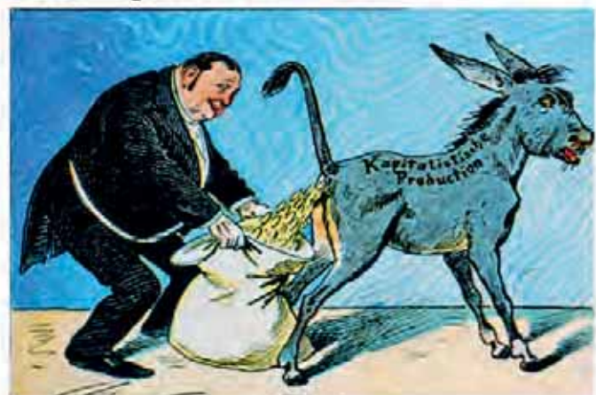
Das ist Umverteilung von unten nach oben.

Im Kapitalismus ist es so, dass jeder Lohnarbeiter weniger erhält, als er erwirtschaftet. Den Differenzbetrag streicht sein Arbeitgeber ein, der genau bese-