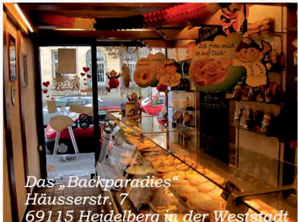
Das „Backparadies“ Häusserstr. 7 69115 Heidelberg in der Weststadt